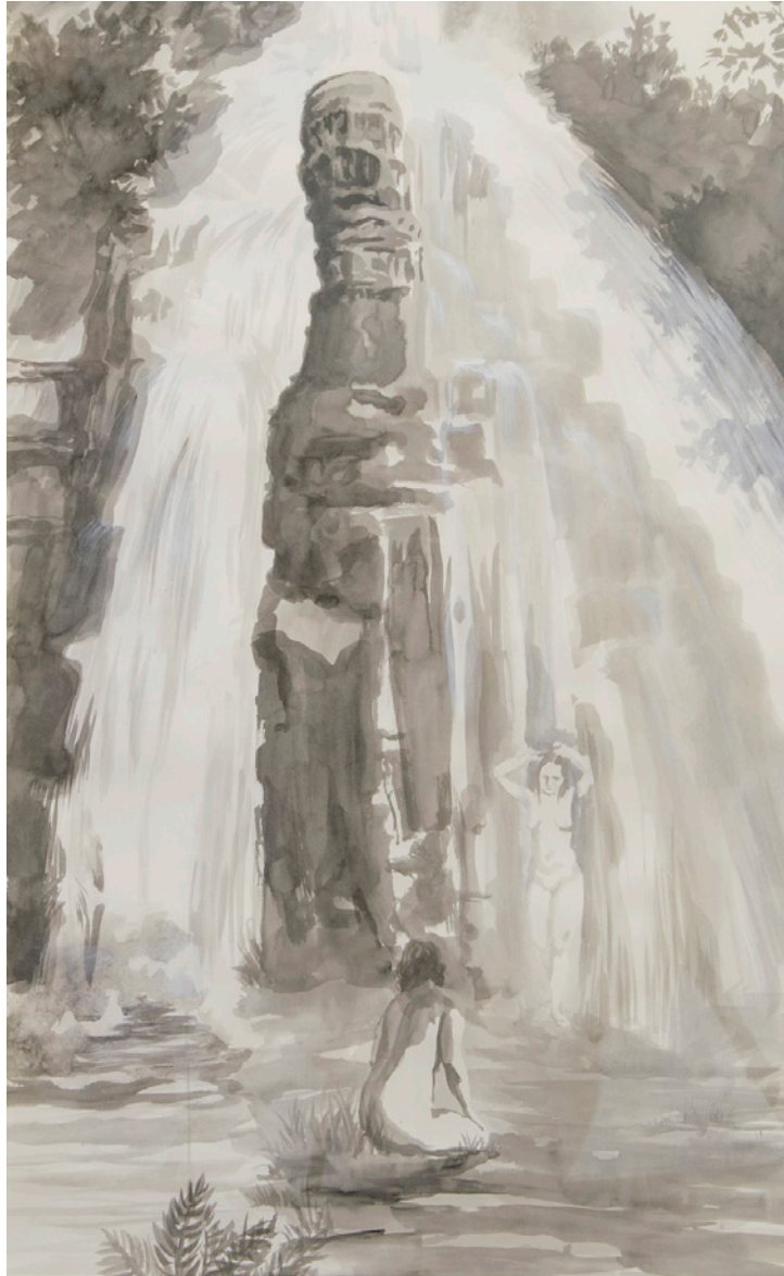
cascade , Tusche auf Papier, 70x177 cm, 2018