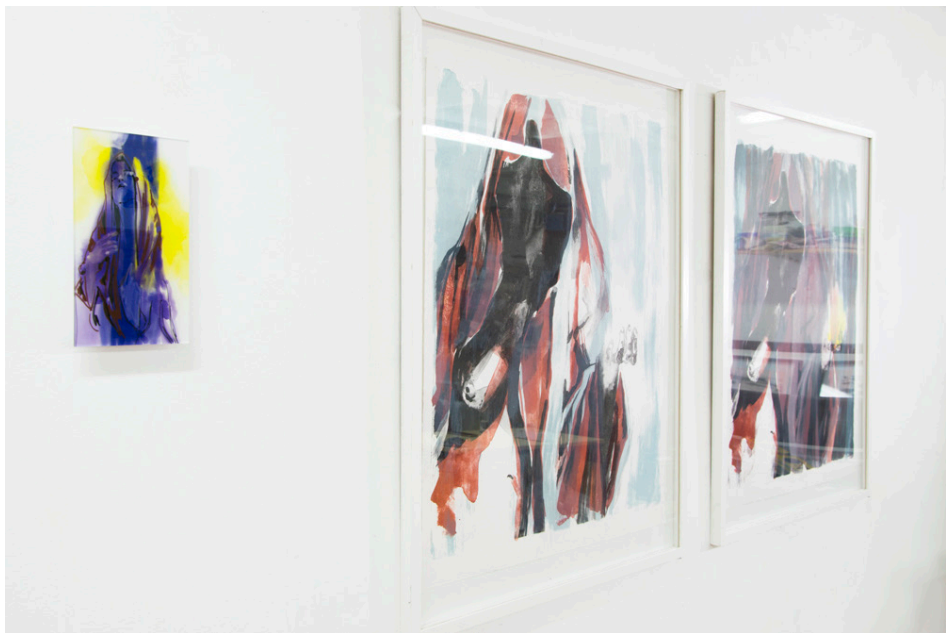
Installationsansicht Madonna, rupture I und rupture II