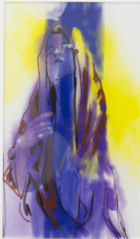
rechts: Madonna , Digitale Malerei, Acrylglasdruck, 14x24 cm, 2018