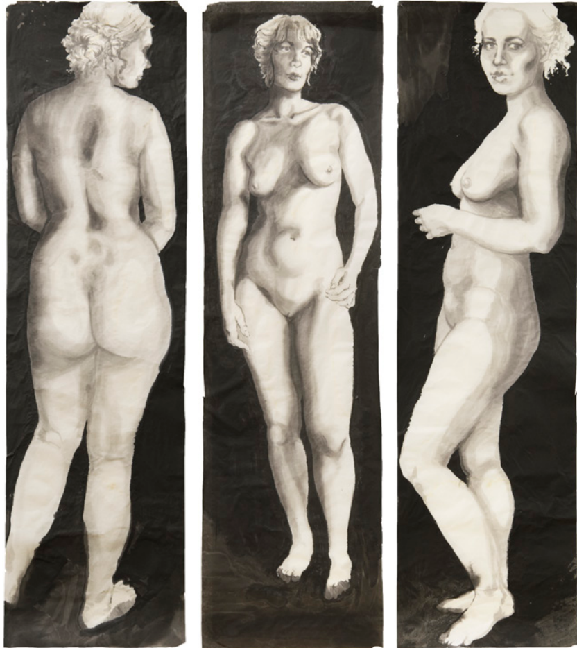
Installationsansicht grazia I , grazia II und grazia III , Tusche auf Japanpapier, je 38x137 cm, 2018/2019