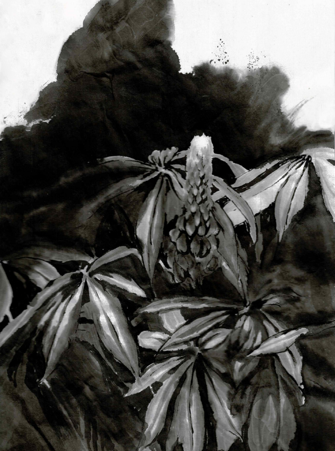
floral I , Tusche auf Japanpapier, 23x34 cm, 2018