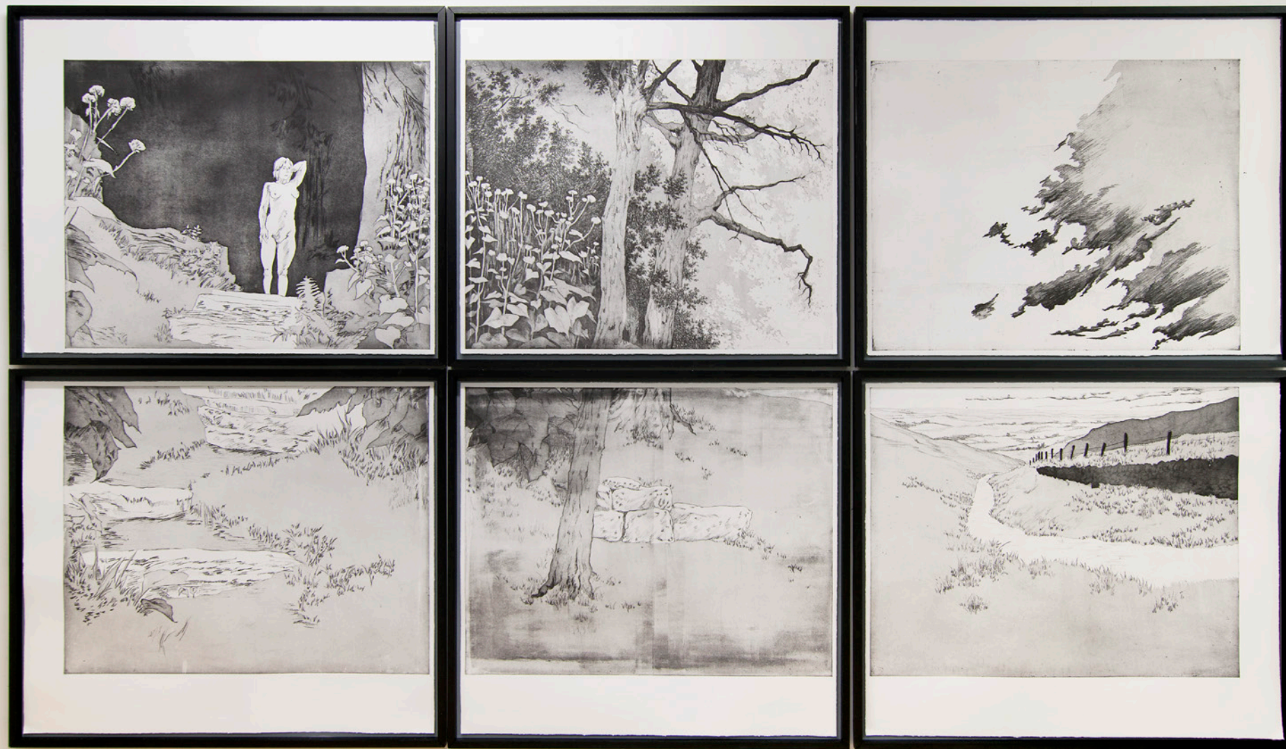
Installationsansicht the path , sechsteilige Radierung auf Büttenpapier, ca. 189x330 cm, 2019