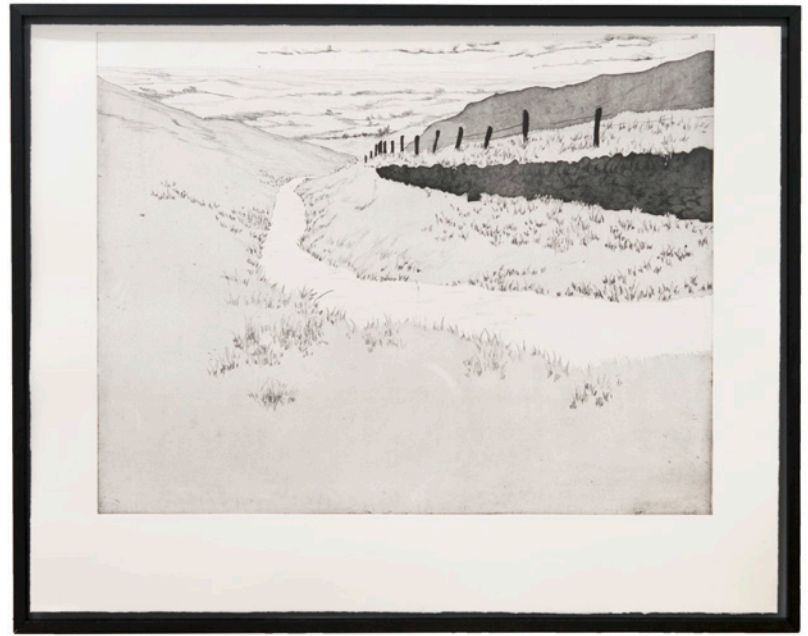
the path III , Radierung auf Büttenpapier, Diptychon, ca. 189x120 cm, 2019