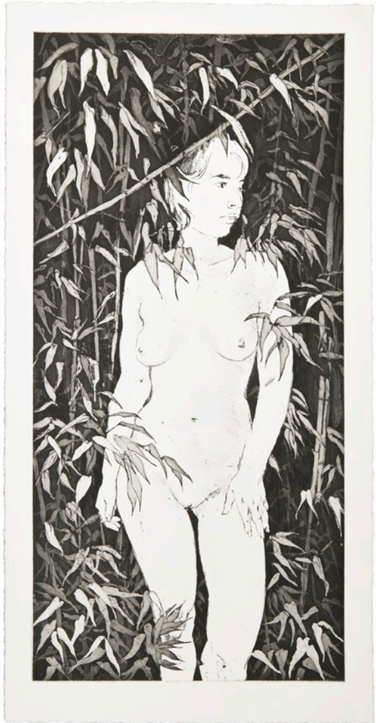
Bambus , Radierung auf Büttenpapier, 28x54,5 cm, 2019