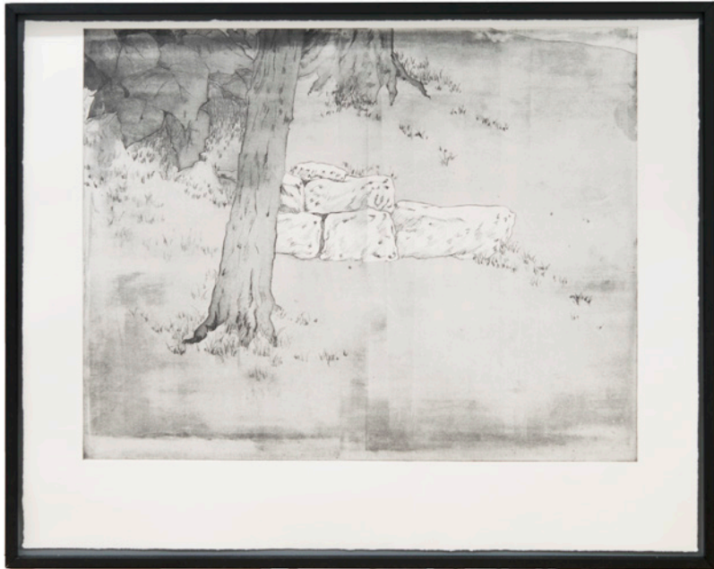
the path II , Radierung auf Büttenpapier, Diptychon, ca. 189x120 cm, 2019