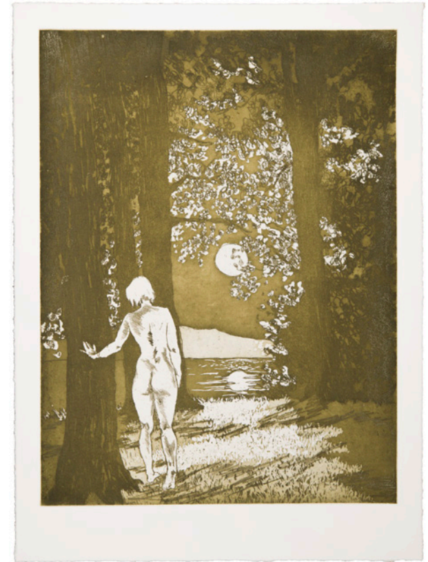
longing , Radierung auf Büttenpapier, 33,7x46 cm, 2019