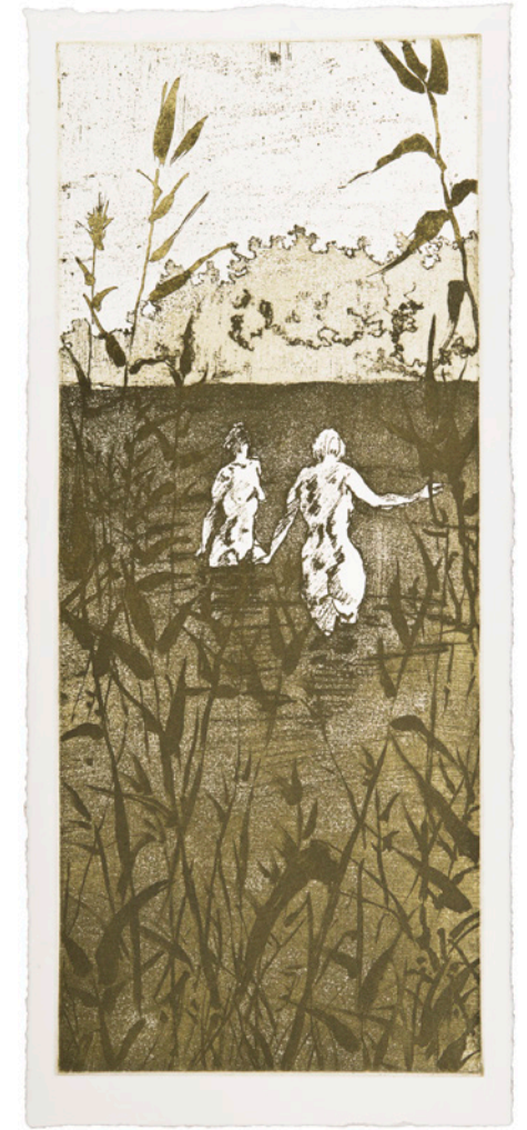
shore , Radierung auf Büttenpapier, 19,5x45 cm, 2019