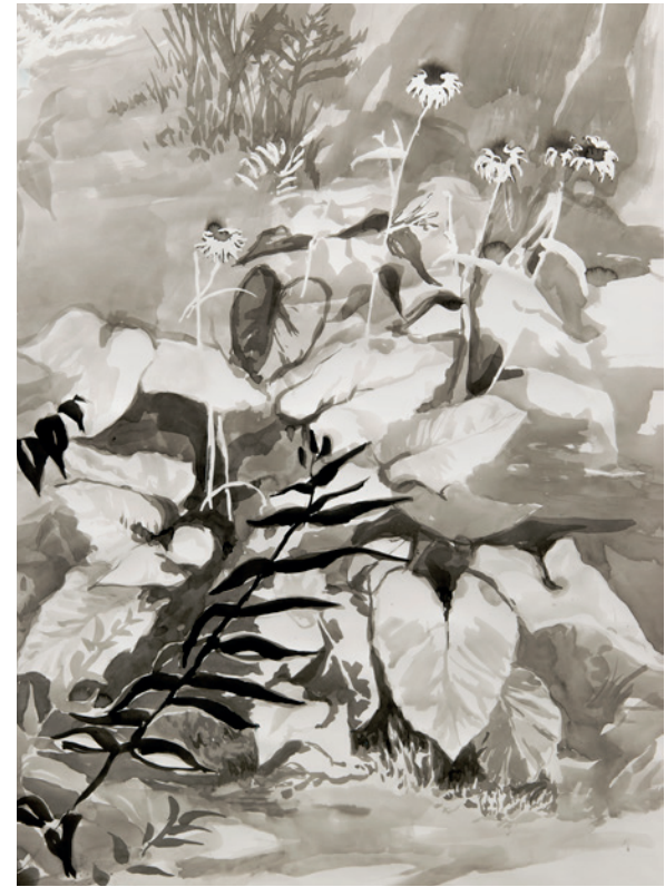
Detailansicht the path