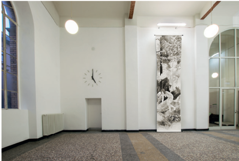
the path , Tusche auf Papierrolle, ca. 1,5x7 m, 2018