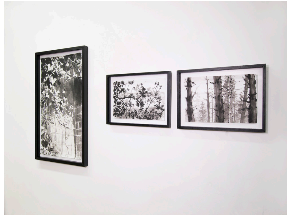
Installationsansicht poison , scenic I und scenic II links: poison , Tusche auf Japanpapier, 38x68,5 cm, 2018